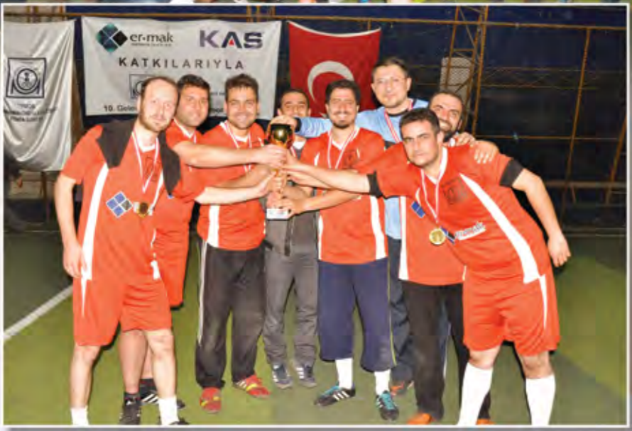
Turnuva Şampiyonu: Yeniçeriler Takımı