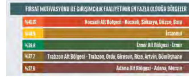
Fırsat Motivasyonu İle Girişimcilik Faaliyetinin En Fazla Olduğu Bölgeler