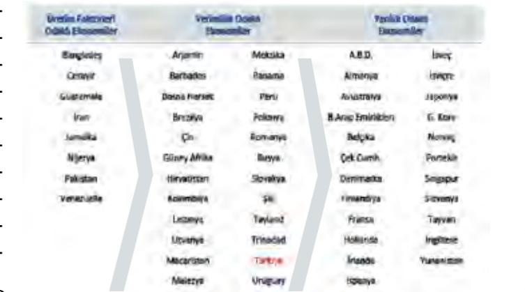
Ülkelerin Ekonomik Yapılarına Göre Sınıflandırması

Dünya Ekonomik Forumu tarafından ülkelerin ekonomik güdümlerine göre bir sınıflandırma yapılmış, bu çalışmaya göre ülkemiz Verimlilik Odaklı Ekonomiler arasında gösterilmektedir. Ülkelerin ekonomik kalkınma seviyesi yükseldikçe, üretim faktörleri odaklı ekonomilerden yenilikçilik yani inovasyon odaklı ekonomilere geçiş olduğu görülmektedir.