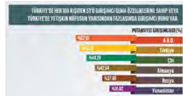
Dünyada En Yüksek Girişimcilik Potansiyeline Sahip Ülkeler

Bu genel bilgilendirmeden sonra girişimcilik ile ilgili ülkemize ait birkaç istatistik sunalım. 2013 yılı istatistiklerine göre Türkiye'nin en hızlı büyüyen ilk 100 şirketi kuran kişilerin, şirketlerini kurduklarındaki ortalama yaşları 31'dir. KOSGEB'in 2009 yılı verilerine göre Türkiye'deki yaklaşık toplam 3.2 milyon KOBİ'nin sektörel dağılımı; % 82'si ticaret ve hizmetler, % 13'ü ise üretim sektörü şeklindedir. 2010 yılı verilerine göre ise girişimcilerin en fazla faaliyet gösterdiği ilk sırada % 40.5 ile toptan ve perakende ticaret; motorlu kara taşıtlarının ve motosikletlerin onarımı, % 17.7 ile ulaştırma ve depolama, % 12.9 ile imalat sanayi yer almıştır.