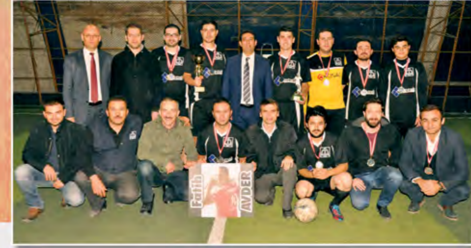
2. olan Avderler Takımı