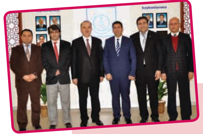
Konya Valisi Muammer EROL