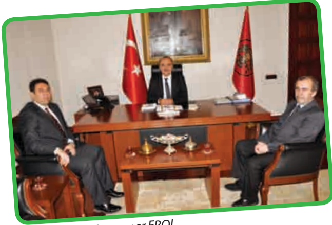
Konya Valisi Muammer EROL