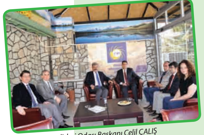
Ziraat Mühendisleri Odası Başkanı Celil ÇALIŞ