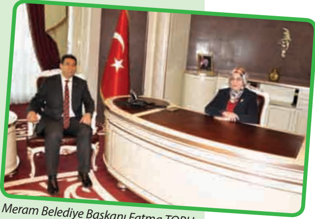
Meram Belediye Başkanı Fatma TORU