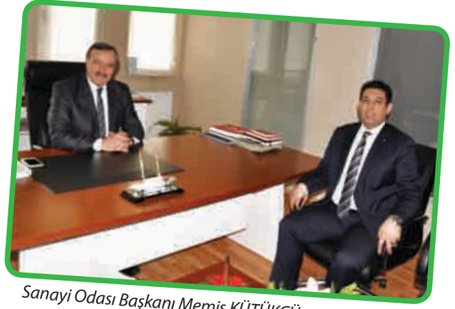
Sanayi Odası Başkanı Memiş KÜTÜKCÜ