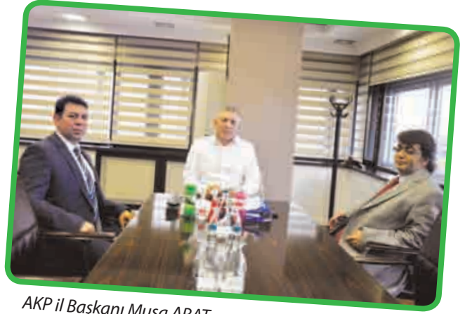
AKP İl Başkanı Musa ARAT