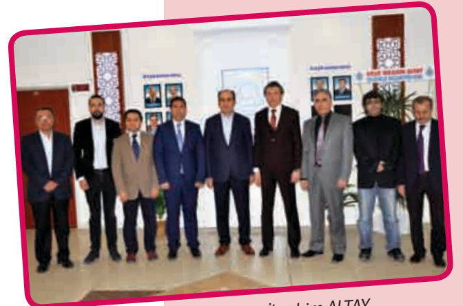
Selçuklu Belediye Başkanı Uğur İbrahim ALTAY