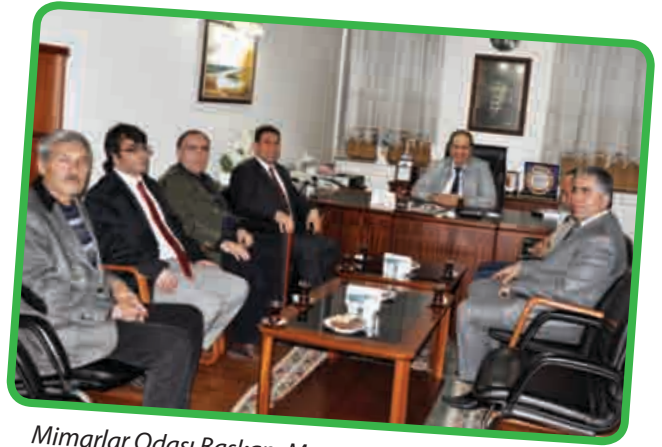
Mimarlar Odası Başkanı Mustafa KAŞ