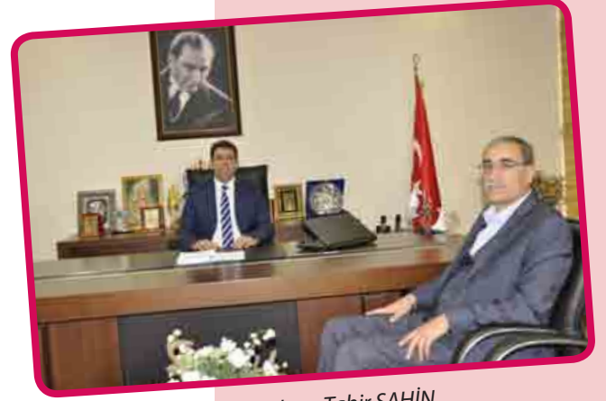
Sanayi Odası Meclis Başkanı Tahir ŞAHİN