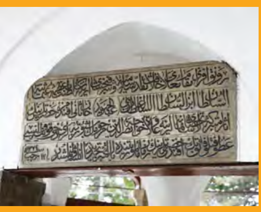
Akşehir'deki Nasrettin Hoca Türbesi ve Kitabesi